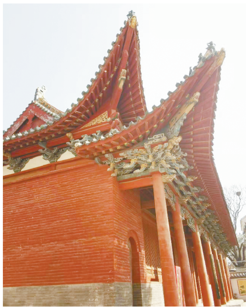
太康文庙中南北文化融合的古建筑结构——重檐歇山顶