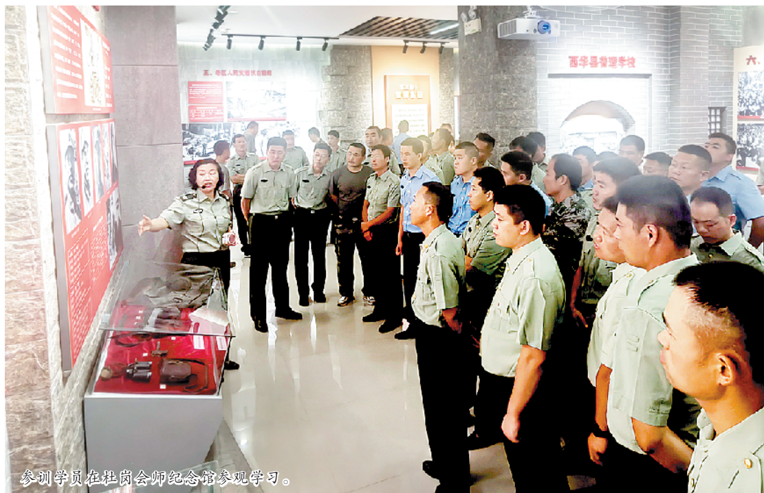
参训学员在杜岗会师纪念馆参观学习。

本报讯(记者陈永团 通讯员张靖文/图)9月18日，2023年度周口市政府安排工作转业士官岗前培训开班典礼在杜岗会师纪念馆举行。举办此次培训，目的是扎实做好军队转业士官安置工作，帮助军队转业士官迈好工作转岗、人生转轨的关键一步，引导他们树立正确的择业观，更好适应新环境。