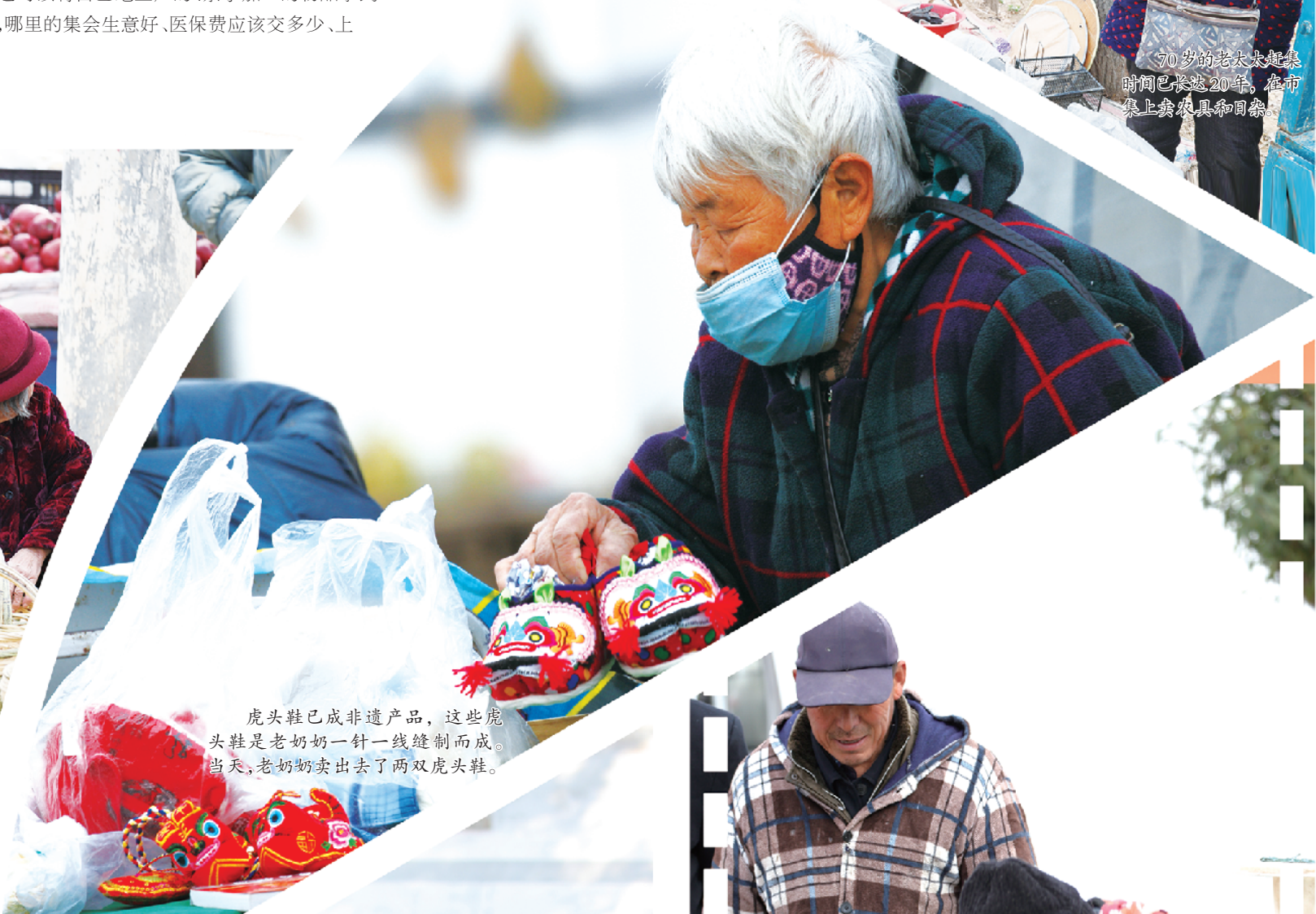
虎头鞋已成非遗产品,这些虎头鞋是老奶奶一针一线缝制而成。当天,老奶奶卖出去了两双虎头鞋。