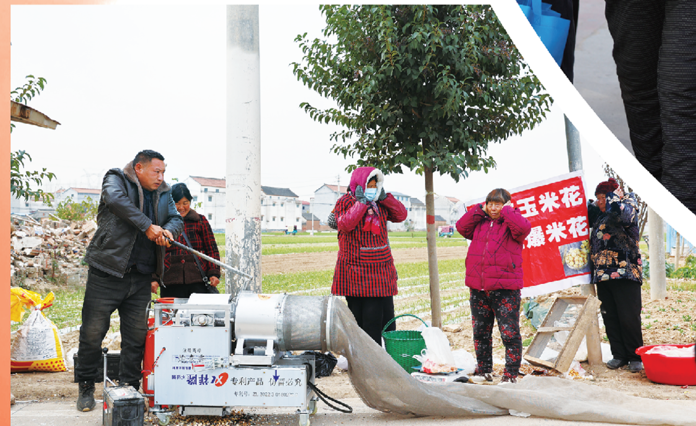
人们记忆中的爆米花机已经升级改造成了“电动+人工”。