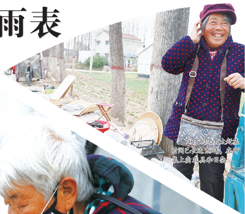
70岁的老太太赶集时间已长达20年,在市集上卖农具和杂粮。

乡村集会又叫赶集、市集,是村民定期定点进行商品交易的一种组织形式,赶集在农村绝对算得上是最热闹的日子。衣服、蔬菜、活鱼、鲜肉、干果、糕点、农具、日杂……记者在走访我市部分乡村集会时看到,集会上各类商品五花八门、琳琅满目,涵盖了村民日常生活的方方面面。 十里八乡的村民在乡村集会上不但可以选购到自己心仪的商品,还可以将自己地里产的、亲手加工的物品拿到市集上进行交易。更重要的是,乡村集会还是乡亲们沟通交流的平台,哪里的集会生意好、医保费应该交多少、上面又有什么新的政策等等,都是赶集的人们交流的热点话题。