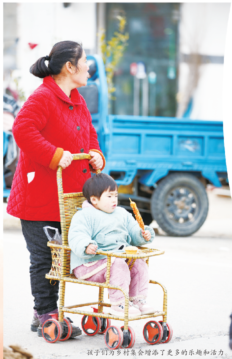
孩子们为乡村集会增添了更多的乐趣和活力。