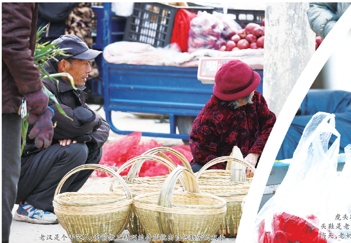
老汉是个手艺人,面前做工精巧的竹篮就出自他勤劳的双手。