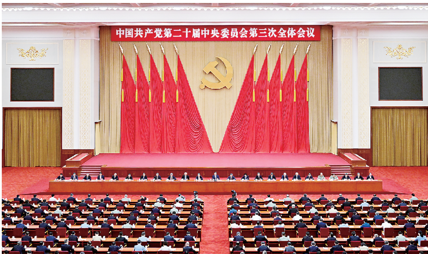
中国共产党第二十届中央委员会第三次全体会议，于2024年7月15日至18日在北京举行。中央政治局主持会议。