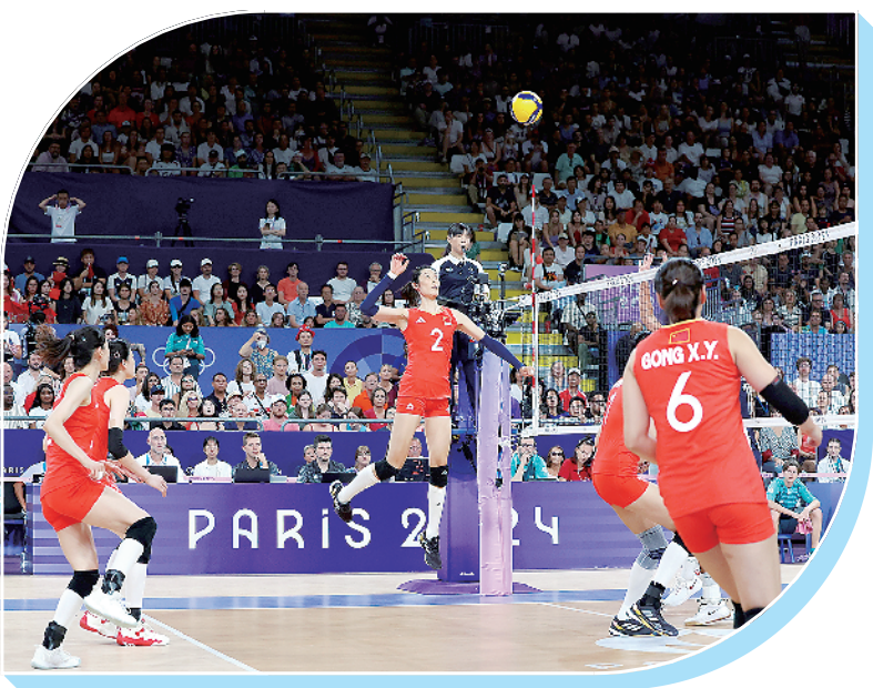
7月29日,中国队球员朱婷(上)在比赛中。当日,在巴黎奥运会排球女子小组赛A组比赛中,中国队3比2战胜美国队。

“当前,我国正处在由知识产权引进大国向知识产权创造大国转变,知识产权工作正在从追求数量向高质量转变的关键时期。”申长雨表示,国家知识产权局将持续提升知识产权治理能力和治理水平,更好发挥知识产权在激励全面创新、促进产业转型、优化营商环境和畅通国内国际双循环等方面的积极作用。(新华社北京7月30日电)