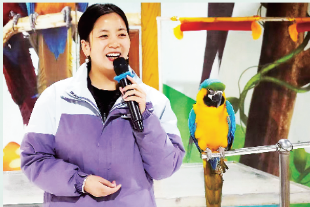
工作人员和鹦鹉互动。