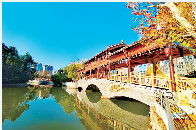
神州鸟园廊桥。

整个采风活动中,会员们通过手中的镜头记录下了一个个美好瞬间。他们精神饱满、热情高涨,充分展现了高超的艺术才华和积极的生活态度。