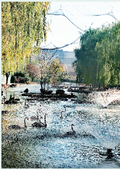
黑天鹅水中嬉戏。