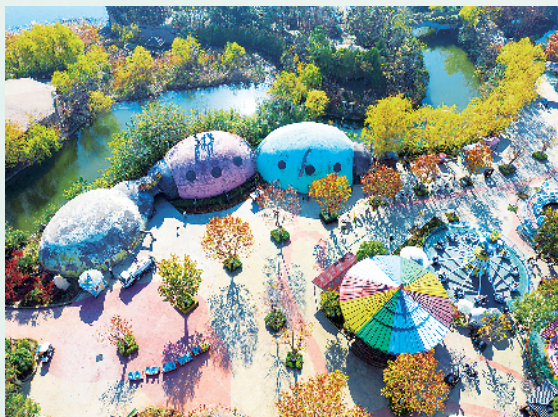
俯瞰鸟蛋博物馆。单红卫 摄