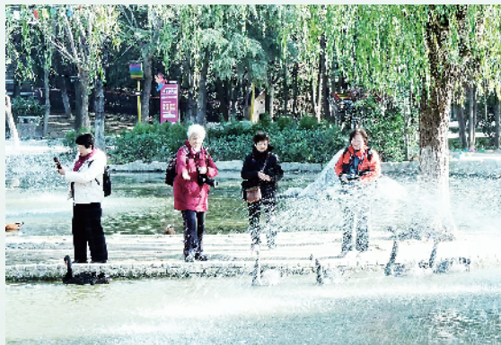
鸟舞翩跹,景美如画。