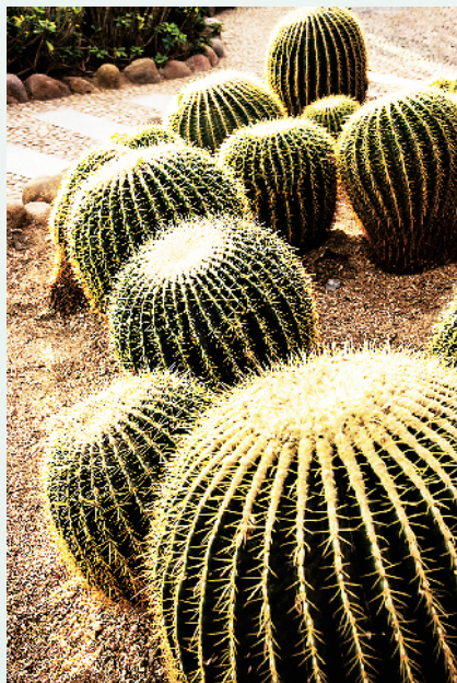
仙人球中的“巨无霸”。