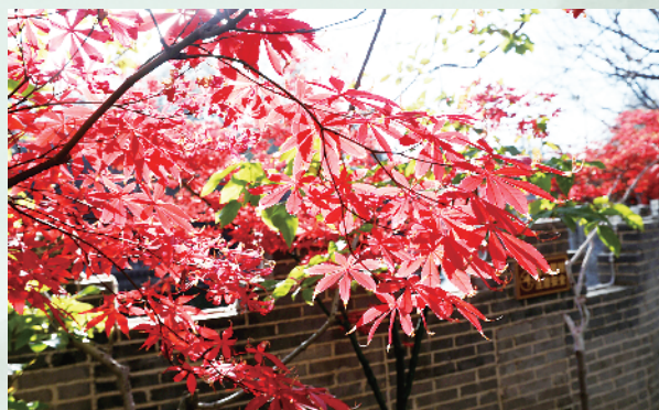
神州鸟园红枫惹人醉。