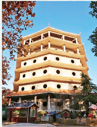
南街村八角楼。